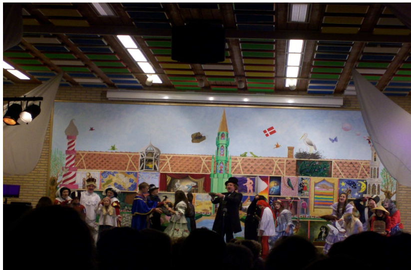
„Hans Christian Andersen“

Die Abende standen ebenfalls unter der Motto „Celebrating Life“. Neben kulinarischen Genüssen sorgten „Hans Christian Andersen“ mit seinen Märchenfiguren und die Beatles-Coverband „The Buutles“ für eine fröhliche Stimmung.