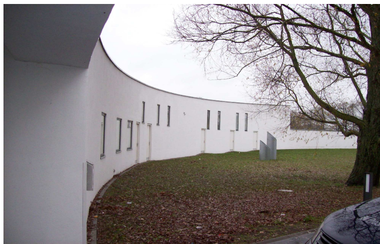
Das Goldene Horn

Dieser alljährlich von der Internationalen Snoezelen Association organisierte Kongress bietet den Teilnehmern die Möglichkeit, sich über das Snoezelen generell, dessen Fördermöglichkeiten und Weiterentwicklung zu informieren und sich auf internationaler Ebene auszutauschen. Diese Kongresse verfolgen auch das Ziel, die wissenschaftliche Untermauerung des Snoezelens voranzutreiben.